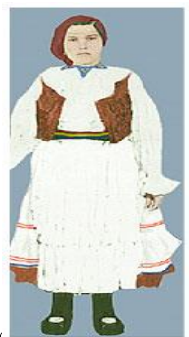
Port popular din satul